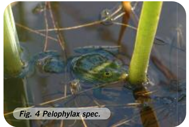
Fig. 4 Pelophylax spec.

Les tas de pierres et de bois sont recherchés par les lézards vivipares et les couleuvres à collier comme refuges et sites d'hibernation (Fig. 5 et Fig. 6).