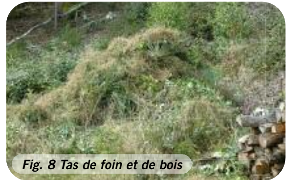
Fig. 8 Tas de foin et de bois

mitoyen. Ce compost est un milieu recherché par les couleuvres à collier lors de la ponte (Fig. 8).