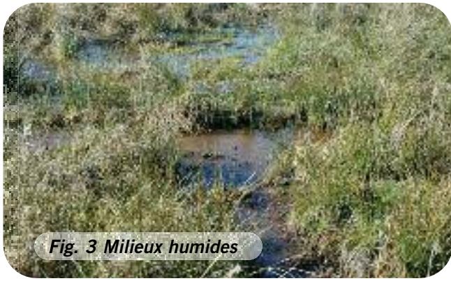
Fig. 3 Milieux humides

Voici la liste des micro-habitats que nous entretenons sur les réserves :