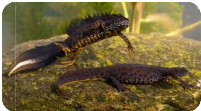
Triton crêté mâle (au-dessus) et femelle (en-dessous) en période nuptiale

Aujourd'hui en Wallonie, comme ailleurs en Europe occidentale, le triton crêté est en forte régression et est considéré comme « menacé ». La principale raison de son déclin est la fragmentation et la destruction de ses habitats, aquatiques et terrestres, causées par l'expansion des villes, la densification du réseau routier, l'intensification de l'agriculture et l'empoisonnement des points d'eau.