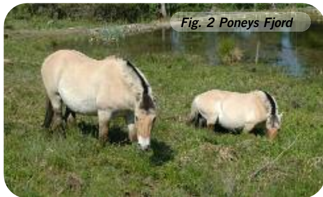
Fig. 2 Poneys Fjord

Au contraire, en faisant pâturer beaucoup d'animaux sur un seul site et dans un laps de temps court, on obtient un résultat comparable à un fauchage mécanique. C'est-à-dire, un brusque passage d'une végétation haute à une végétation rase. Dans ce cas, même si au final la charge annuelle reste faible, il ne s'agit plus de pâturage extensif mais de « fauche animale ». Ce type de gestion peut donner de bons résultats pour la flore, mais est catastrophique tant pour l'entomofaune que pour l'herpétofaune.