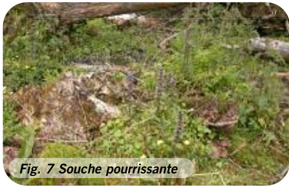
Fig. 7 Souche pourrissante

Les souches pourrissantes et les vieux troncs couchés au sol sont très appréciés par les jeunes orvets (Fig. 7). Lors de la restauration de sites, il faut veiller à ne pas gyrobroyer l'entièreté de la surface déboisée.