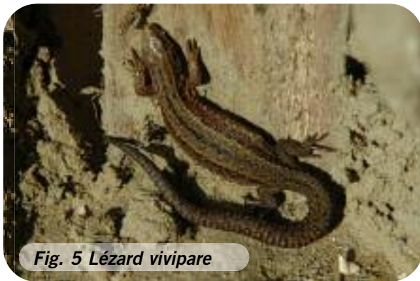
Fig. 5 Lézard vivipare

Les tas de pierres sont issus d'anciennes pratiques agro-pastorales (pierre de champs). Ceux-ci sont régulièrement rechargés avec les pierres que nous dégageons le long des clôtures électriques lors du nettoyage estival de celles-ci. Ce ramassage permet de ne pas émousser les lames des débroussailleuses.