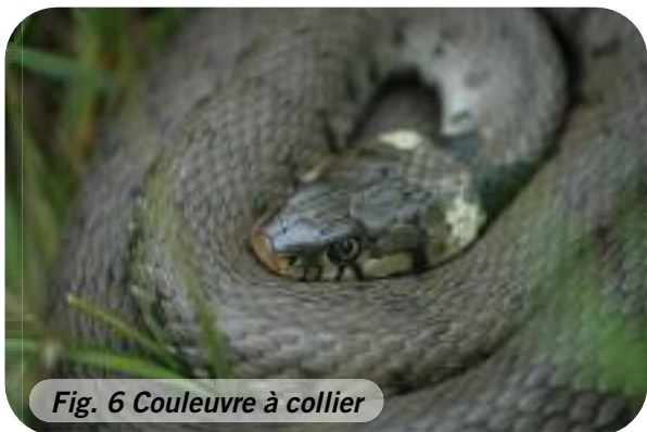
Fig. 6 Couleuvre à collier

Des tas de bois de chauffage ou de piquets de chêne sont disséminés sur la réserve, selon les travaux d'éclaircie ou de clôture. Ce sont principalement les dernières couches de bois en contact avec le sol qui sont utilisées par les jeunes lézards vivipares. Il est capital de ne pas déplacer celles-ci en hiver afin de ne pas déranger l'herpétofaune en hibernation.