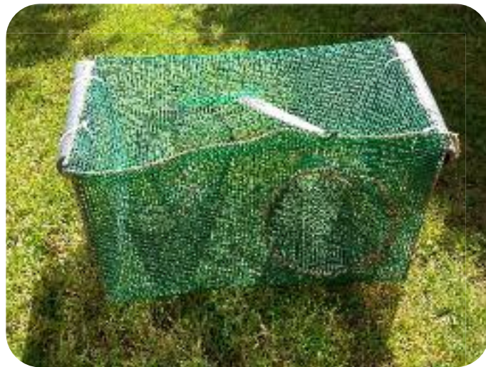
Modèle de nasse en treillis plastique utilisée pour l'inventaire d'amphibiens

Ensuite, afin de mieux cibler les zones où il serait intéressant de restaurer ou de creuser des mares, le réseau écologique des points d'eau liés au triton crêté a été établi. Celui-ci offre un aperçu visuel de l'ensemble des taches d'un habitat, appelées « les nœuds », et des flux migratoires possibles entre celles-ci, nommés « les liens ». Dans le cas présent, les nœuds sont les mares et les liens relient ces mares (occupées ou non) à distance colonisable (1 km) des mares de présence. Cependant, pour que le triton crêté puisse se déplacer d'une mare à l'autre, une distance inférieure à 1 km entre les mares ne suffit pas, il faut également que les différentes occupations du sol entre celles-ci permettent son passage. Par exemple, il se peut que deux mares proches ne puissent être reliées par le triton crêté si un obstacle tel qu'une route, une rivière ou une zone bâtie les sépare. Pour connaître les mares accessibles aux tritons crêtés en tenant compte à la fois de la distance parcourue et des obstacles, des chemins « de moindre coût » ont été tracés depuis les mares de présence vers les autres mares. Ces chemins tiennent compte des différentes occupations du sol et simulent la trajectoire de moins de 1 km la moins risquée qu'emprunteraient les tritons entre deux mares.