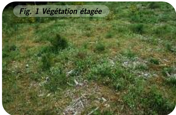
Fig. 1 Végétation étagée

Les sites sont gérés par pâturage extensif avec des poneys Fjords (charge de 0,15 à 0,3 UGB/ha.an) en veillant à étaler leur présence sur plusieurs mois (Fig. 2). Ce type de pâturage permet en effet de donner du « relief » à la végétation en créant une mosaïque de plages de végétations rases, moyennes et hautes sur quelques mètres de distance (Fig. 1). Ce type de modulation est fondamental tant pour l'abondance des proies, que pour offrir des zones de chasse, de refuge ou encore de bain de soleil à l'herpétofaune.