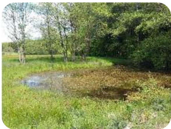
Route de Mortinsart-Nantimont ↑↓

Les résultats montrent que le réseau écologique des mares de Lorraine est « déconnecté ». Autrement dit, il est morcelé en de nombreux micro-réseaux déconnectés les uns des autres et comprenant peu de mares colonisées par le triton crêté. A long terme, ce réseau n'est donc pas viable pour l'espèce et nécessite d'être amélioré.