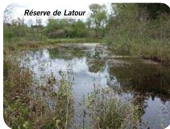
Réserve de Latour